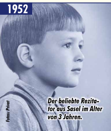
1952 Der beliebte Rezitator aus Sasel im Alter von 3 Jahren.