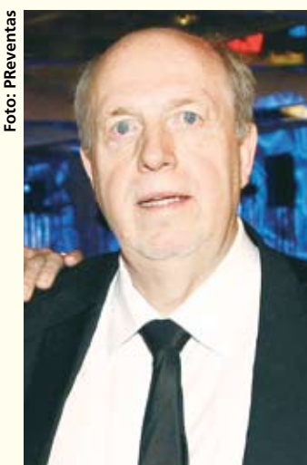
Rainer Callmund, Ex-Fußballmanager von Bayer Leverkusen

MH: Nach meiner Karriere als Formel-1-Fahrer, die nun schon einige Jahre zurück liegt, habe ich interessante und lukrative Werbeverträge angeboten bekommen. Ich finde es jedoch auch wichtig, sich für humanitäre Zwecke einzusetzen. Heute bin ich als Laudator und Pate der Hermes Charity-Auktion hier. Gemeinsam mit anderen prominenten Kollegen spenden wir private Dinge für den guten