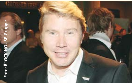
Mika Häkkinen, Formel-1-Weltmeister

Gesprächsfreudig erleben wir auch den sonst eher zurückhaltenden Johannes B. Kerner, der in lustiger Plauderlaune einiges verrät.