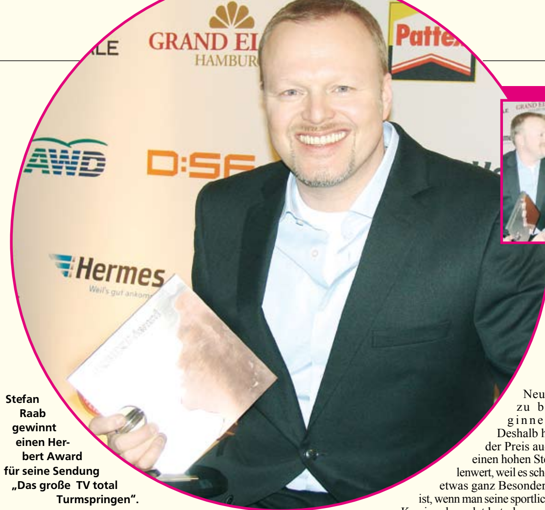
Stefan Raab gewinnt einen Herbert Award für seine Sendung „Das große TV total Turmspringen“.

Der Herbert Award ist ein renommierter Medienpreis, der alle zwei Jahre von Sportlern an Journalisten in unterschiedlichen Kategorien verliehen wird. Dieses Jahr fand er Ende März im Grand Elysee statt. Rund 750 Gäste wurden an die Alster geladen. Unter Ihnen die Creme de la creme, die Elite der Sport- und Medienwelt. Das Alster-Magazin war vor Ort.