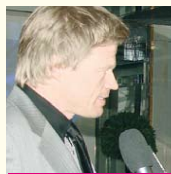
Oliver Kahn, ehem. Profi-Fußballer

JK: Ich würde sagen ja, zwar nicht so oft, aber man findet welche. Man kann über das Kollegiale hinaus befreundet sein. Béla Réthy und ich sind beispielsweise Freunde.