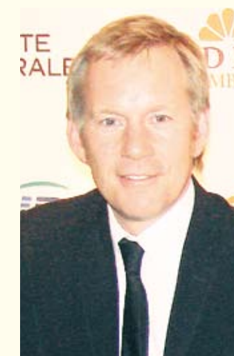
Johannes B. Kerner, Fernsehmoderator und Autor

Rainer Callmund: Der Herbert Award wurde nach Herbert Zimmermann, einem früheren Radioreporter, benannt. Er war schon damals eine absolute Reporter-Legende und wurde durch seine Fußball-Moderation weltbekannt.