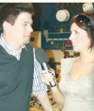
Sprach mit Tim Mälzer: Redakteurin Jeannine Ehmsen – zu sehen als Filmbeitrag unter www.alstertv.de!

Deutschlands bekanntester Koch und Kochbuchautor wurde am 22.1.1971 in Elmsborn geboren. Von 1992-1995 absolvierte er im Hotel Inter Continental in Hamburg seine Ausbildung. Es folgten u.a. Anstellungen im „Ritz“ in London und im Hamburger „Tafelhaus“. 2002-2007 gehörte ihm das „Weiße Haus“. Den Durchbruch schaffte er 2003 mit der Sendung „Schmeckt nicht – gibt’s nicht“ auf Vox (Goldene Kamera 2006). Seit 18.4. ist der Eppendorfer mit „Tim Mälzer kocht!“ jeweils samstags um 15:30 Uhr in der ARD zu sehen.