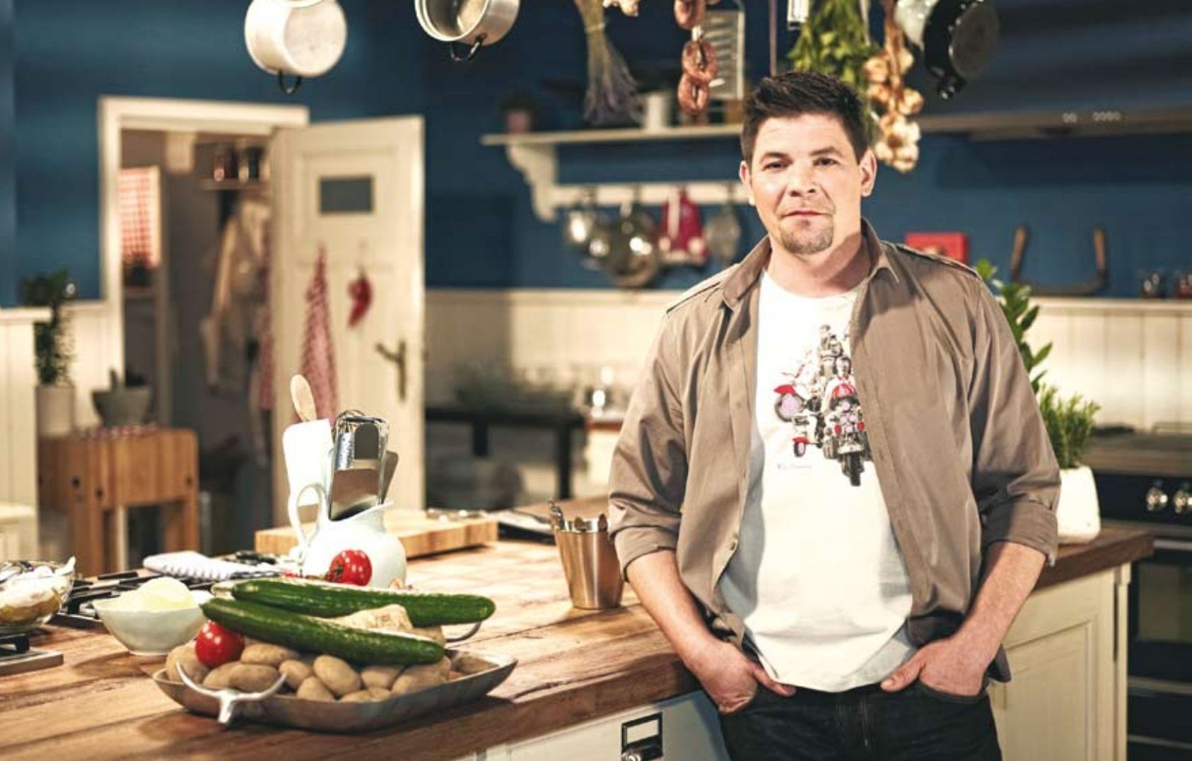
Tim Mälzer kehrte nach längerer Drehpause auf den Bildschirm zurück.