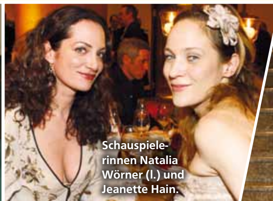
Schauspielerinnen Natalia Wörner (l.) und Jeanette Hain.